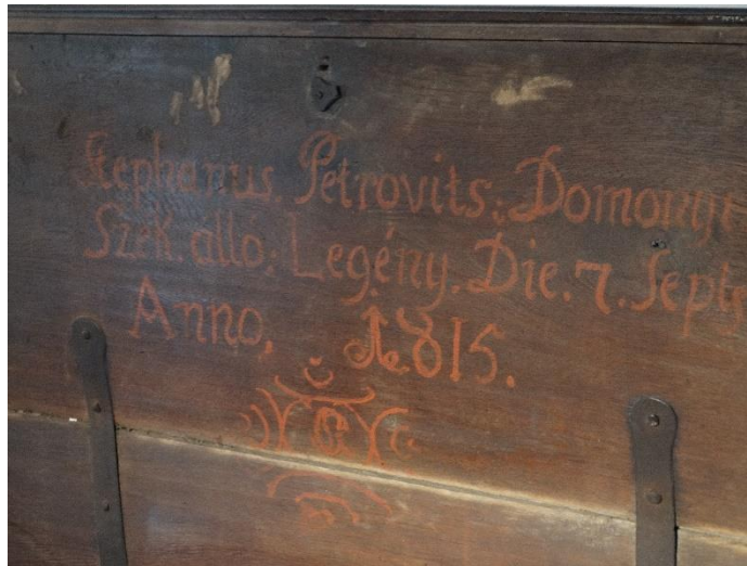
Petrovics István legényládája