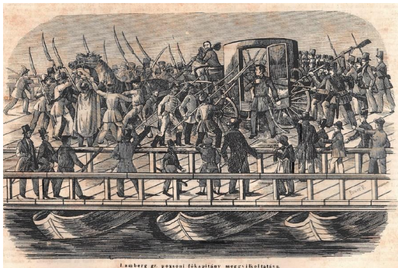
Lamberg Ferenc királyi biztos felkoncolása