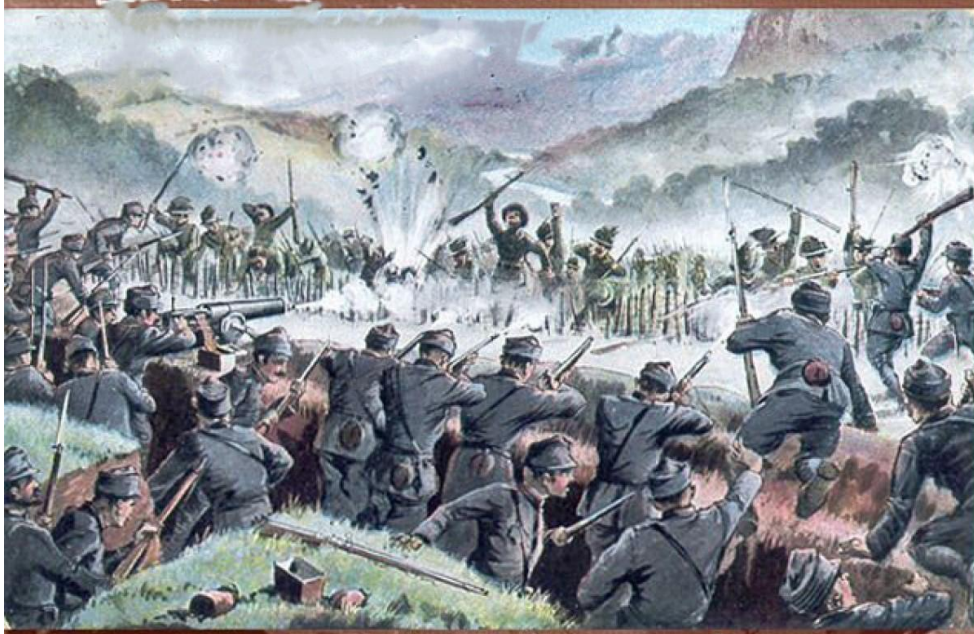
Harcok az olasz fronton

A feladat az első világháborúval kapcsolatos. Válaszolj a feltett kérdésekre a forrás és előzetes tanulmányaid segítségével!