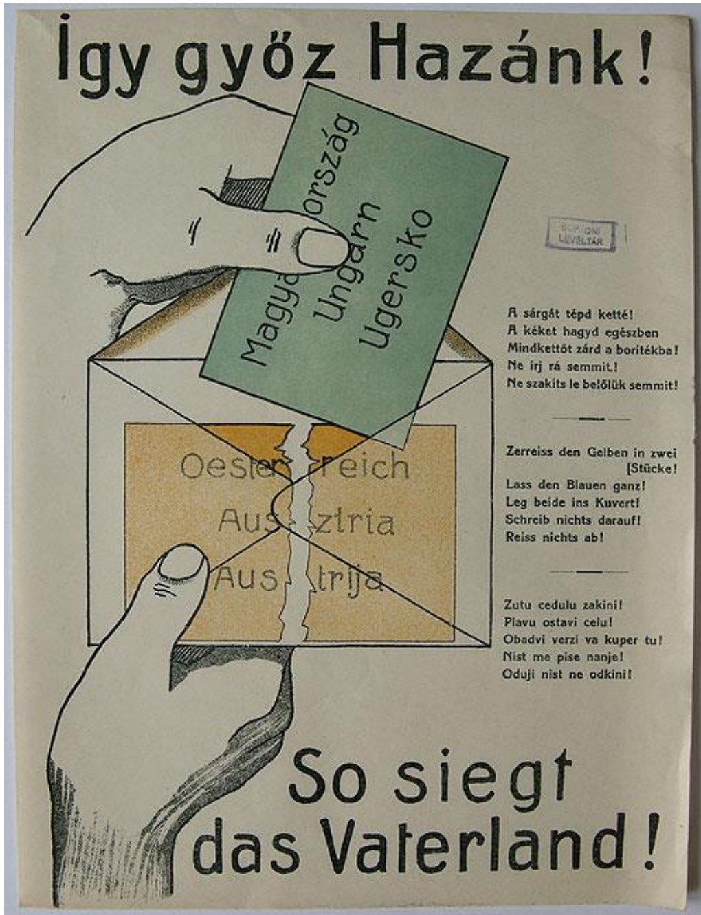
Röplap a népszavazásról (1921)

2. A feladat a soproni népszavazáshoz kapcsolódik. Oldd meg a feladatokat a forrás és ismereteid segítségével!