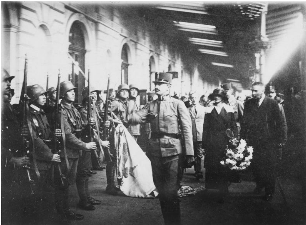
IV. Károly a győri pályaudvaron. A csapatait fegyveres erővel Budaörsnél állították meg